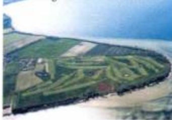
Golfanlage Hohen Wieschendorf

Golfanlage Hohen Wieschendorf Am Golfplatz 1, 23968 Hohen Wieschendorf Tel. 0 384-286 60, www.golfclub-howido.de 18 Loch-Platz, Par 72, 5727 m