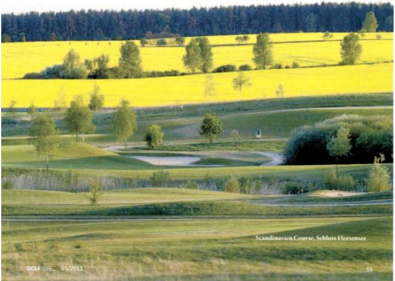
Scandinavien Course, Schloss Fleesensee