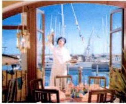
Entspannen am Strand der Yachthafenresidenz Hohe Düne, schlemmen mit Blick aufs Wasser oder gar bei Sterne Koch Tillmann Hahn, Golf spielen im Golfclub Warnemünde