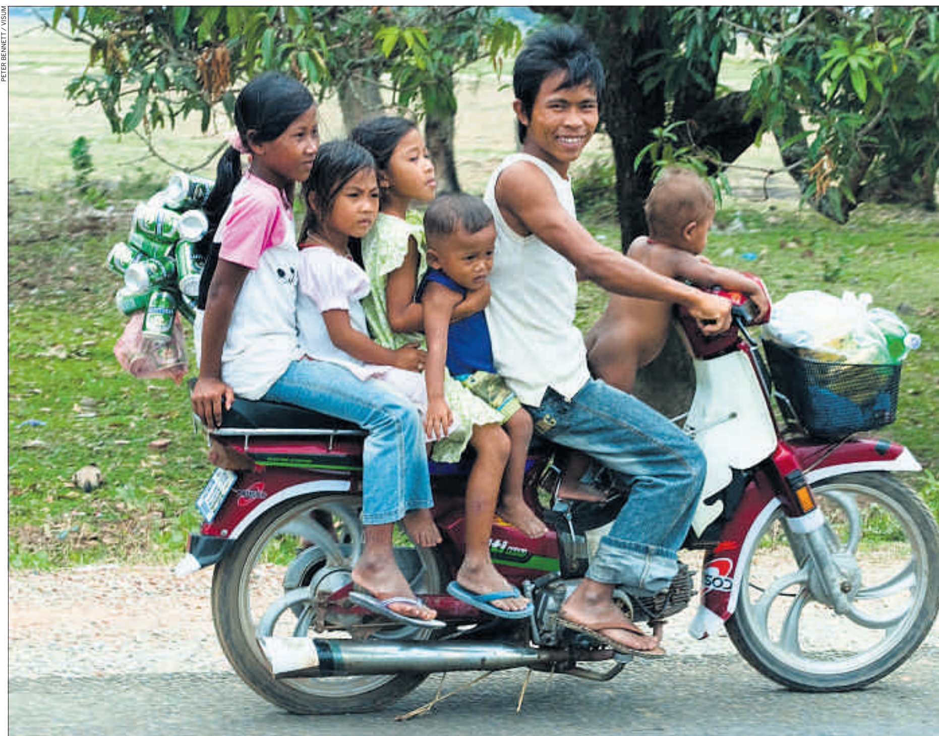
Familienausflug in der Hafenstadt Kep, dem einstigen Luxusort Kambodschas.

er, australische Gastwirte oder buddhistische Juristen mit einem gediegen-schicken Café, das auch in jeder europäischen Grossstadt als trendy durchgehen könnte. Natürlich hat auch Ministerpräsident Hun Sen seine Villa direkt an der Strandpromenade, und gleich zwei Hotels bedienen die anspruchsvolleren Gäste im Ort. Vor dem weitläufigen (meist leeren, weil über-teuerten) Sokha Beach Hotel wartet eine sieben Meter lange Limousine auf Kundschaft.