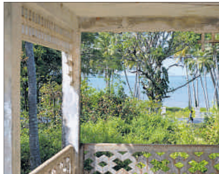
Der Stil der Kolonialzeit ist in Kep allgegenwärtig.

www.knaibangchatt.com, DZ ab zirka 166 Fr. (April–September), zirka 222 Fr. (Oktober–März). Aus den Ruinen auferstanden: Hotel Independence, Tel. +855 34 93 43 00/303, Internet: www.independencehotel.net . Rösti und Internet gibt es in der Kep Lodge, Tel. +855 92 43 53 30, Internet: www.keplodge.com , DZ ab 30 Fr.