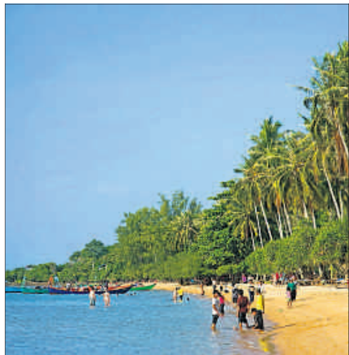
Der Strand von Rabbit Island, in der Nähe von Kep.