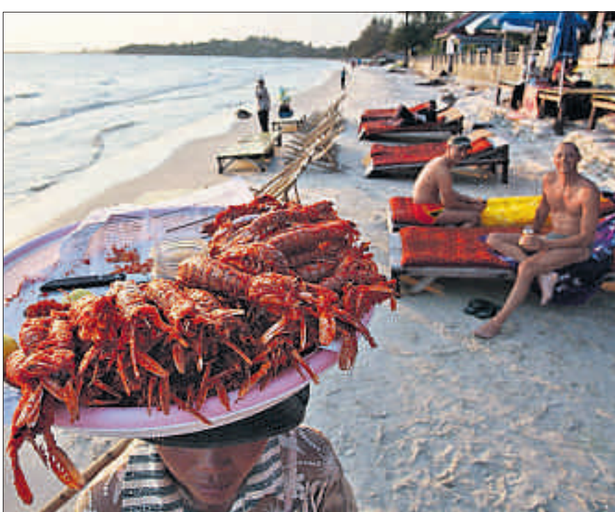
Hummer gibt es in Sihanoukville fast wie Sand am Strand des Golfes von Siam.