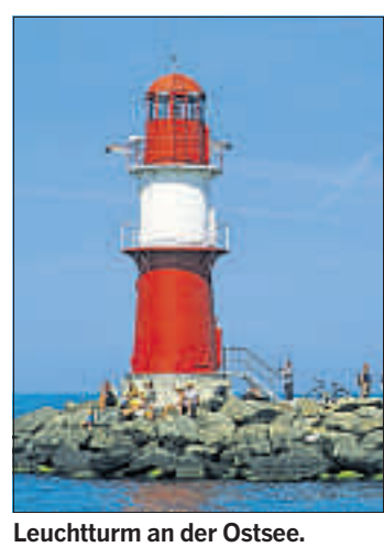
Leuchtturm an der Ostsee.

berg 13 (11), Homepage: www.altstadrestaurant.de . Shopping: Shopping-Fieber stillt man im Dreieck von Lange Strasse, Doberaner Platz und Kröpeliners Strasse, z. B. im Kröpelinertor-Center (12), www.ktc-rostock.de . Typisches Ostseesouvenir: Bernstein, zu finden im Bernsteinhaus