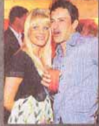
▲ Schauspieler Gedeon Burkhard (39, „Alarm für Cobra 11“) kam mit Freundin