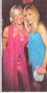
► Nova Meierhenrich (35, „Verbotene Liebe“) entzückte im sommerlichen Blumenkleid

Warnemünde – Sie feierten bis zum Morgengrauen! Großer Star-Auflauf in der Yachthafenresidenz Hohe Düne: Das Internet-Portal starcookers vergab hier am