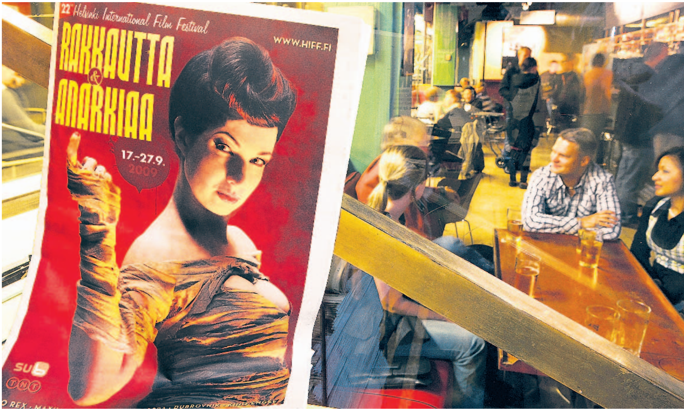
Bei einer cineastischen Lokalrunde durchs lebhaftige Kampen-Viertel gibt es Wodka und Bier.

wandelt, die „Café Ekberg“ heißt und immerhin mit gerhusamen Brunch auffahren kann.