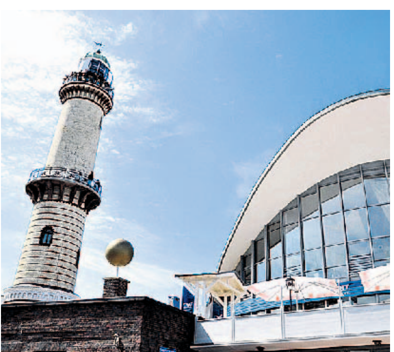
Der alte Leuchtturm ist das Wahrzeichen von Warnemünde.

spiegelt. Deshalb gab er seinem Restaurant auch einen Fischnamen mit Ostsee-Bezug. „Der Butt ist sympathisch, hat beste Eigenschaften, einen fantastischen Geschmack und das Flair von Luxus“, sagt der Sternkoch. Gemeint ist der Steinbutt, der mit seinen schief sitzenden Augen etwas seltsam aussieht. „Aber auch bei unseren Nahrungsmitteln kommt es nicht auf das Äußere an, sondern auf den Inhalt.“ Der Plattfisch ist zudem ein Fabelwesen im ursprünglich vorpommerschen Märchen der Gebrüder Grimm Vom Fischer und seiner Frau , wo der Butt als verwunschener Prinz erscheint. „Es ist ein Plädoyer gegen Maßlosigkeit“, meint Hahn, der in der Erzählung eine Parabel zu seiner Philosophie über gesunde Ernährung sieht. Bei der Wahl der Zutaten entscheidet er sich für erstklassige, möglichst regionale Produkte aus biologischer Herstellung. Er arbeitet mit Produzenten zusammen, die nicht in Masse, sondern in Maßen produzieren, mit Landwirten und Manufakturen besetzt die Inselspitze an der Warvenversprechen: Getrocknete Rentier-Chips, Elch-Streichwurst, Bäregulasch aus der Dose zählen hier zu den Takeaway-Rennern.