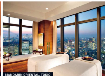
MANDARIN ORIENTAL, TOKIO