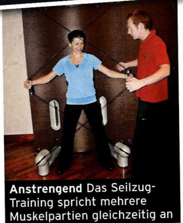
Anstrengend Das Seilzug-Training spricht mehrere Muskelpartien gleichzeitig an