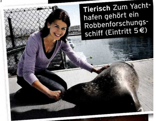
Tierisch Zum Yachthafen gehört ein Robbenforschungsschiff (Eintritt 5 €)